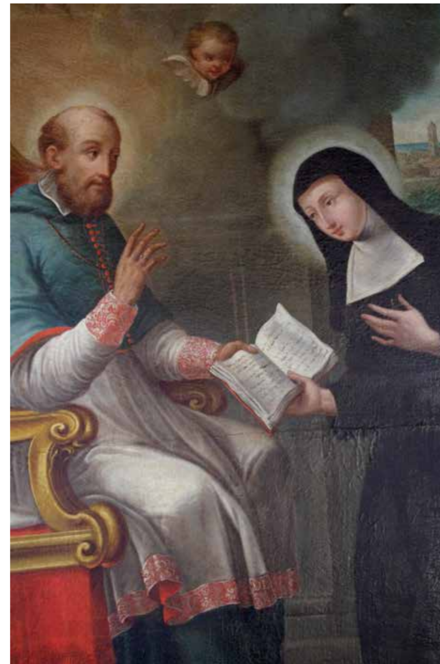
❖ Ritratto di San Francesco di Sales e Jeanne de Chantal, dipinto (dettaglio).

Per la sua qualità e diversità, la documentazione presenta un grande potenziale, che in parte ho già esplorato, riflettendo alla possibilità di pubblicazioni, legate soprattutto ai futuri anniversari. La valorizzazione passa quindi dalla divulgazione e dalla sensibilizzazione, coinvolgendo nuovi attori e canali, e dalle possibilità di collaborazione, in particolare con il Museo parrocchiale di San Sebastiano.