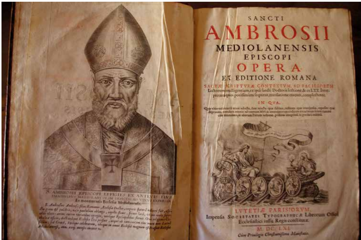
❖ Edizione illustrata dell'opera di Sant'Ambrogio, Parigi 1661.

vavano disposti in uno stato assai differente. V'erano intere scatole per cui andava esaminato tutto il contenuto ancora sparso e faldoni contenenti materiale già identificato e informatizzato. Ho anzitutto reso gli spazi agibili e funzionali per il lavoro di riordino, inventario e aggiornamento, con un occhio di riguardo specifico per la parte più pregiata della documentazione. Ho così concentrato il materiale in appositi contenitori, modificato la disposizione di quanto conservato negli armadi ignifughi e proceduto all'etichettatura sulla cassettera metallica delle pergamene.