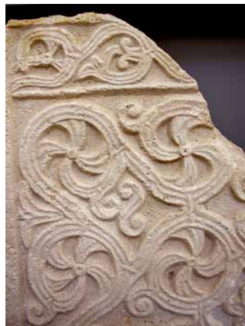
❖ Antica parete divisoria della chiesa carolingia, con nodi celtici, bestiario medievale e motivi floreali di epoca romanica.

positivo avuto finora sia con i docenti che con gli allievi fa ben sperare per un graduale inserimento a pieno titolo dell'Archivio come memoria storica e presenza viva sul territorio. ◆