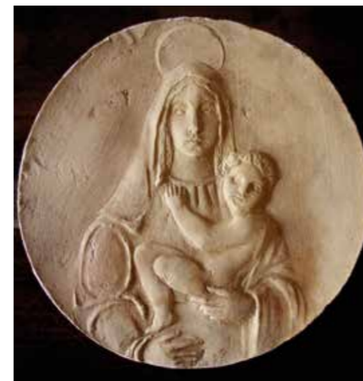
❖ Effigie della Madonna della Fontana di Ascona, gesso (XIX secolo).

Per i documenti pregiati, mi preme rilevare la pergamena del XVII secolo, in bellissima scrittura barocca con tanto di sigillo in cera. Quest'ordinanza in tedesco dei Cantoni sovrani si distingue dalle altre pergamene, più antiche (XV e XVI secolo), in curato stile gotico e scritte in latino. Meritano particolare attenzione i libri antichi (XVII e XVIII secolo), con pregiate edizioni illustrate