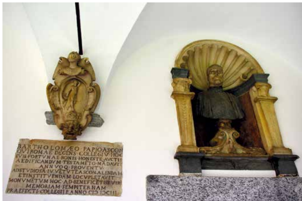
❖ Busto di Bartolomeo Papio, benefattore del Collegio, con dedica.

Riteniamo fondamentale trasmettere alle future generazioni una catalogazione organica dei documenti che costituiscono la storia della Comunità Cattolica di Ascona, con le testimonianze e le opere compiute da coloro che prima di noi, in diverse funzioni religiose ed amministrative, in momenti storici a volte molto difficili, hanno contribuito, con gli enti comunali e patriziali, a creare quello che oggi è il Borgo di Ascona, che spicca nel panorama del