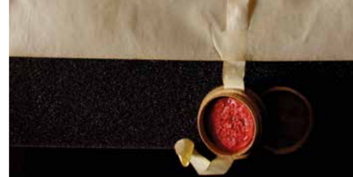
❖ Ordinanza dei Cantoni sovrani ai baliaggi comuni, pergamena con sigillo in cera (XVII secolo).

Ein Blick auf die antiken und wertvollen Dokumente, die wie ein illustrierter Codex Seiten von Geschichte und Gedächtnis, Kultur und Brauchtum zeigen.