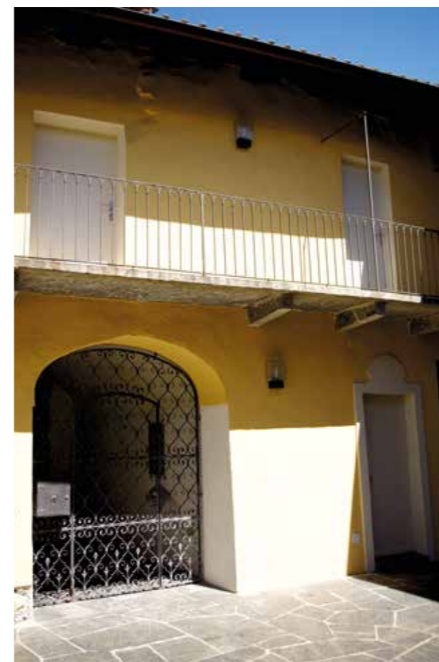
❖ Cortile della casa parrocchiale: al piano superiore i locali dell'Archivio.