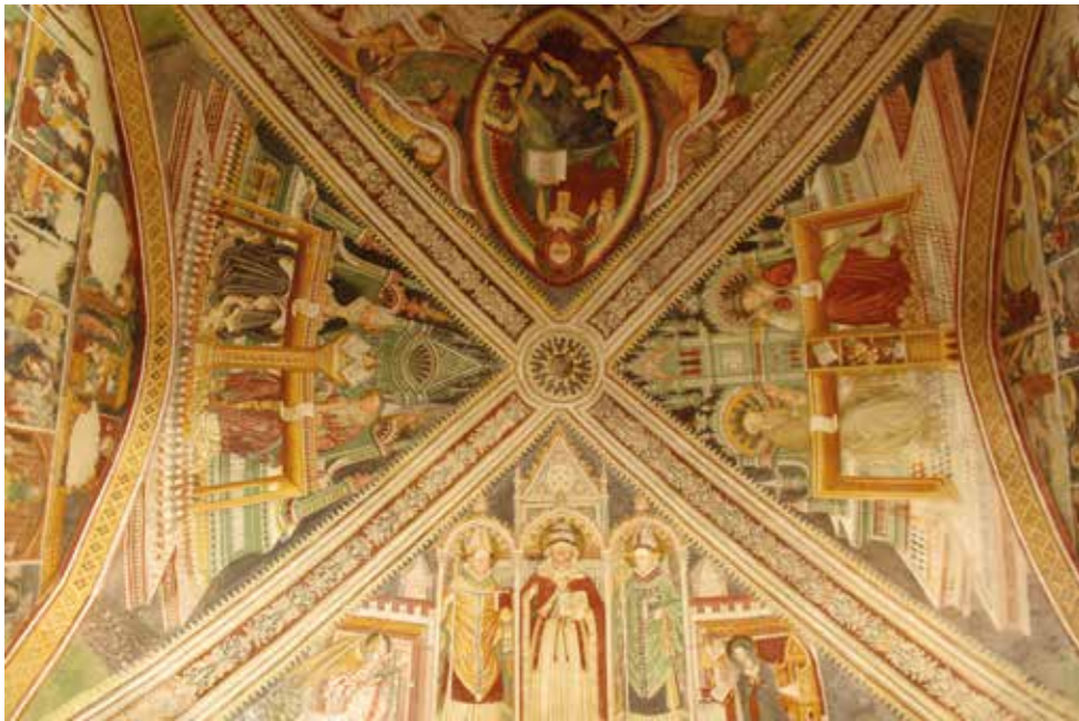
❖ Volta affrescata dell'abside con Santi vescovi, Padri e Dottori della Chiesa e la Majestas Domini con le allegorie degli Evangelisti.