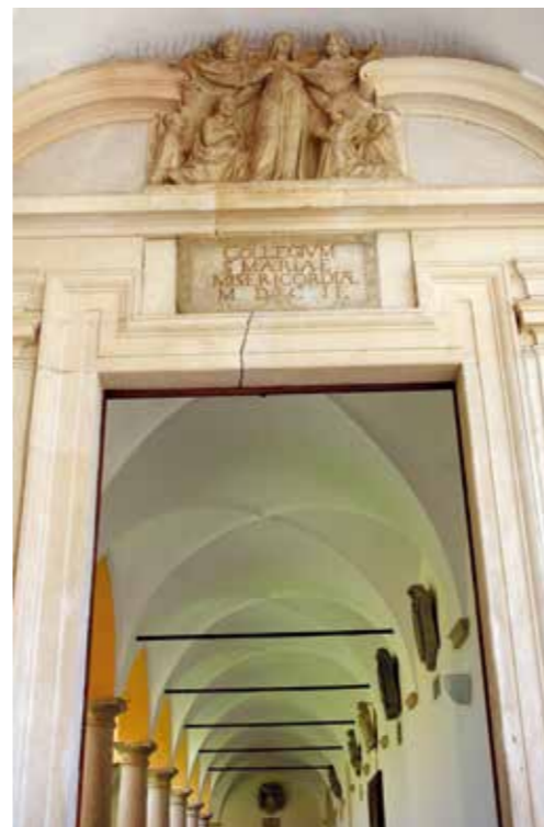
❖ Entrata del chiostro con Madonna della Misericordia, insegna, stemmi e arcate.

La situazione iniziale era molto eterogenea: i diversi tipi di documenti si tro-