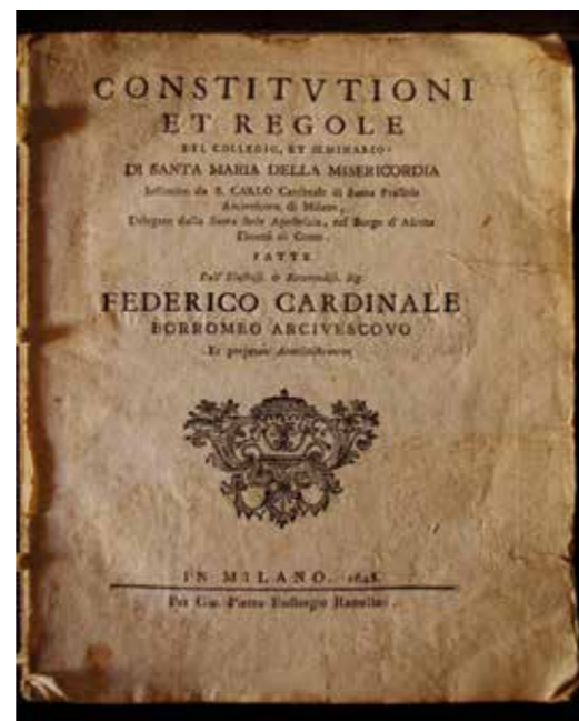
❖ Regolamento di Federico Borromeo, vescovo di Milano, per il Collegio (XVII secolo).

I progressi a livello di riordino sono l'avanzamento dell'opera di selezione e di suddivisione del materiale, secondo la doppia esigenza, tematica e cronologica. Questa attività occuperà ancora un certo tempo, poi bisognerà prevederne di ulteriore per la catalogazione sul piano informatico, anche per il fondo dei periodici. Disponendo di uno stato di conservazione ottimale, non si presentano situazioni di urgenza: si possono così orientare gli sforzi alla qualità del lavoro, nell'ottica dei progetti in parte già avviati, concepiti e pianificati per il prossimo futuro.