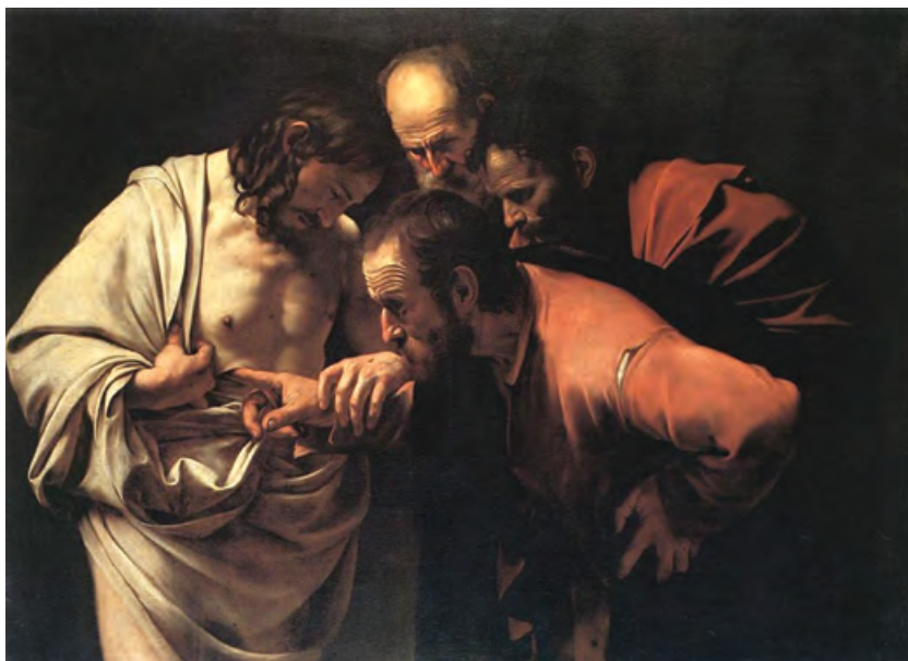
Michelangelo Merisi da Caravaggio Incredulità di san Tommaso , 1600-1601 olio su tela, 107×146 cm Bildergalerie, Potsdam (Germania)

Occorre riscoprire questa dimensione ecclesiale del credere, riscoprendo il valore della domanda che precede l'amministrazione del battesimo: "Cosa chiedi alla Chiesa di Dio?", risponde il battezzando o i padrini per lui: "La fede". La Chiesa è prima della fede dei suoi membri ed il singolo credente può vivere solo grazie alla fede della Chiesa.