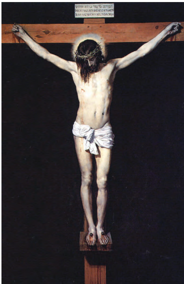
Diego Velázquez Cristo in croce , 1632 olio su tela, 248x169 cm Museo del Prado, Madrid (Spagna)

“chi crede in me ha la vita eterna” (Giovanni 6,47).