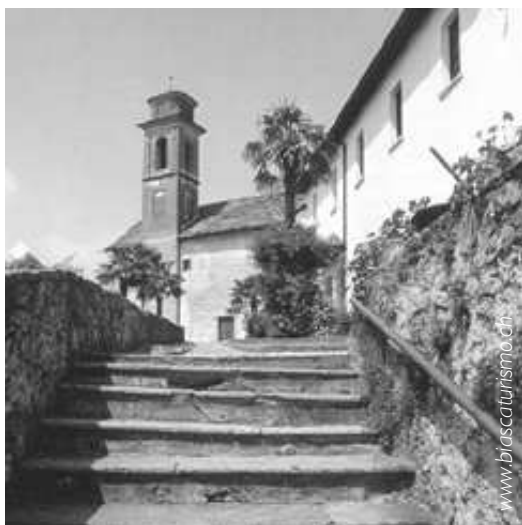
Monastero di Santa Maria Assunta, Claro