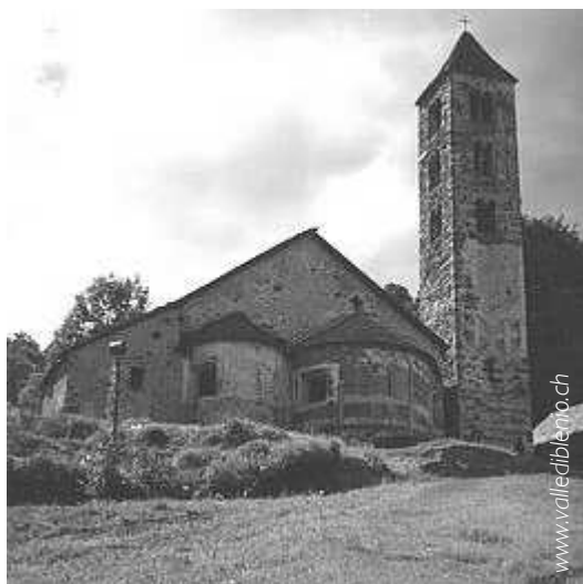
Chiesa di S. Ambrogio Vecchio, Negrentino