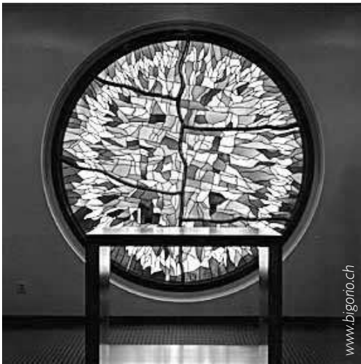
Cappella della Casa Sorriso, Tenero