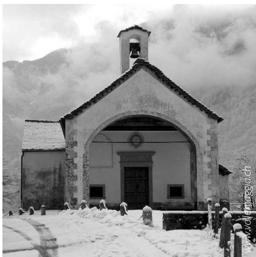
Chiesa della Madonna delle Grazie, Maggia