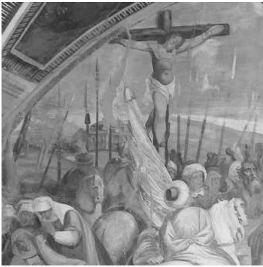
Affresco della Chiesa di San Bernardo, Monte Carasso