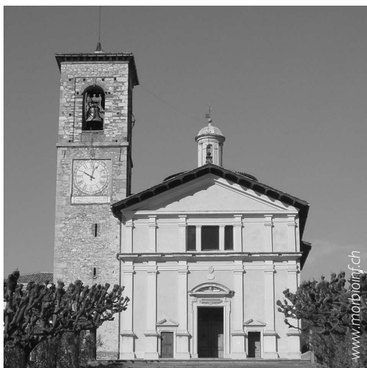
Basilica di Santa Maria dei Miracoli, Morbio Inferiore