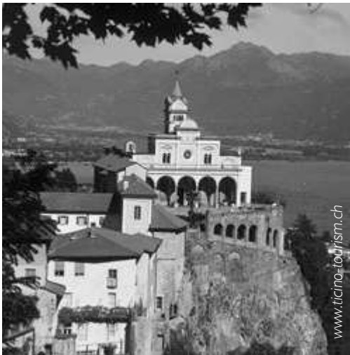
Santuario della Madonna del Sasso, Orselina