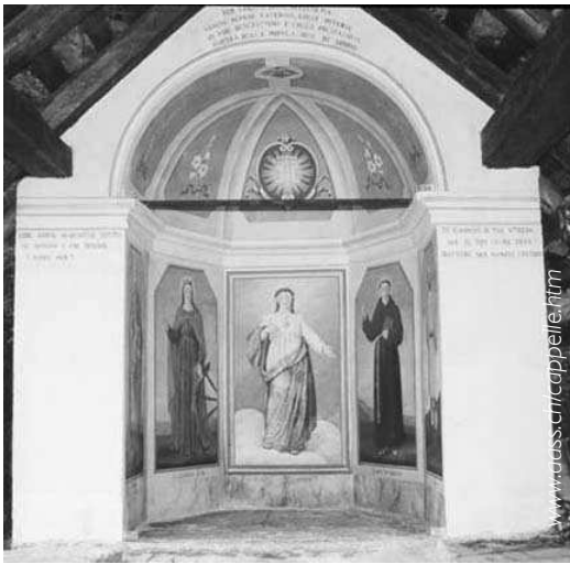
Cappella di Vili, Sobrio